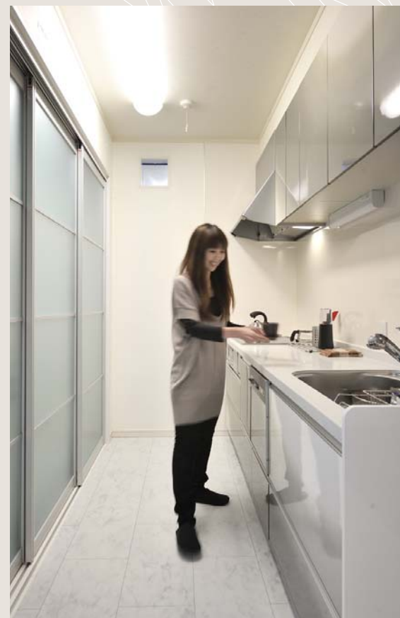
漆塗りの面板が美しいオリジナルキッチン。大型収納庫によっていつもスッキリ片付いている。

開放的なワンルーム空間に 二人のこだわりをカスタマイズした スタイリッシュなリビングダイニング 心豊かに毎日を楽しみながら 永く住み続けたい理想の住まいが実現した。