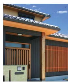
▲お客様を迎える太い玄関柱